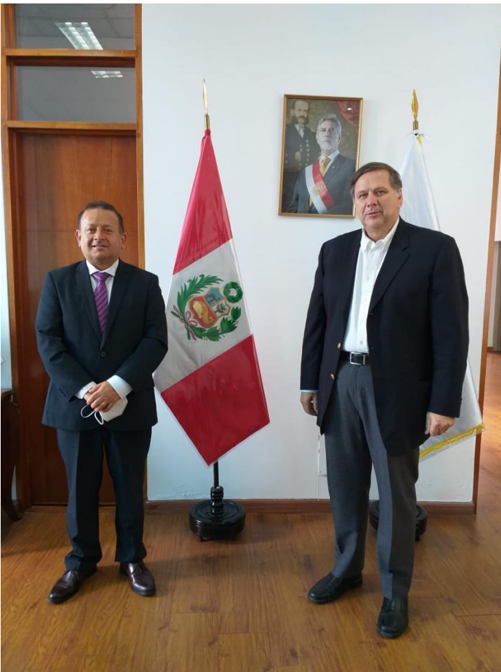
Foto Cónsul Perú en Arica