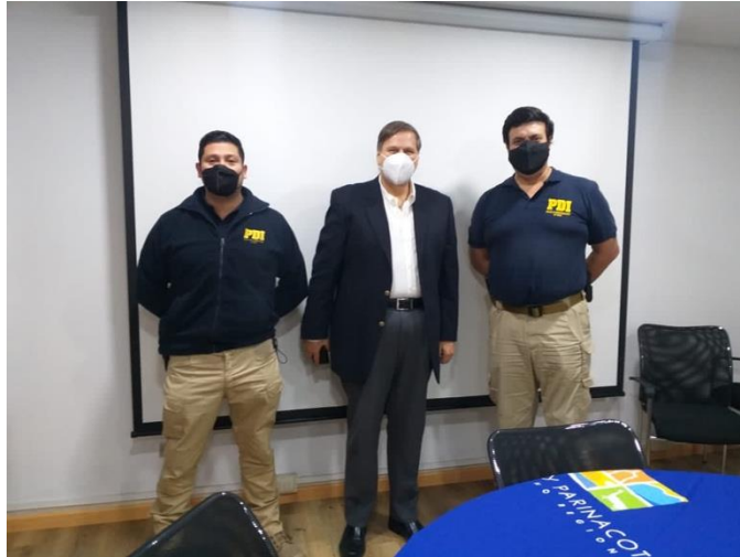
Reunión PDI Arica