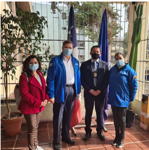
Consulado Móvil Copiapo, Reunión PDI