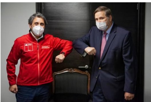
Intendente para la Región De Antofagasta.

El Cónsul Santiago Montoya quien llegó a finales de febrero, ha organizado reuniones con autoridades de diferentes poblaciones de la circunscripción, principalmente con aquellas quienes tienen mayor relación con los procesos migratorios y los procesos penales. Con esto se ha logrado una comunicación más fluida y colaboración mutua, siempre en beneficio de los ciudadanos. También se han realizado reuniones con pares para discutir temas comunes que afectan a la comunidad colombiana.