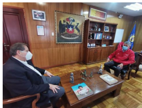
Intendente para la Región De Arica