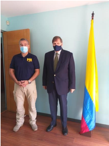
Reunión PDI Antofagasta