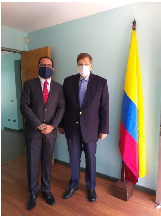
Defensoría del Pueblo